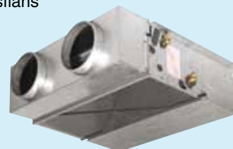
Med PMC - fördelningslåda