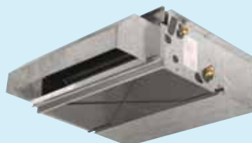
Med FM90 - 90° utloppsfläns

Mått IV-IO Bredd: 1148 mm Höjd: 248 mm Djup: 511 mm Vikt: 38 kg